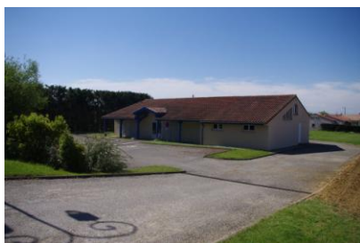
Salle des fêtes des Varennes

Depuis le printemps, plusieurs « chantiers » ont été menés à bien, dont plusieurs en collaboration avec des habitants du village que nous remercions.